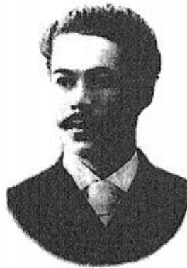
А. С. Аренский