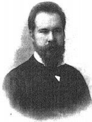
С. И. Танеев