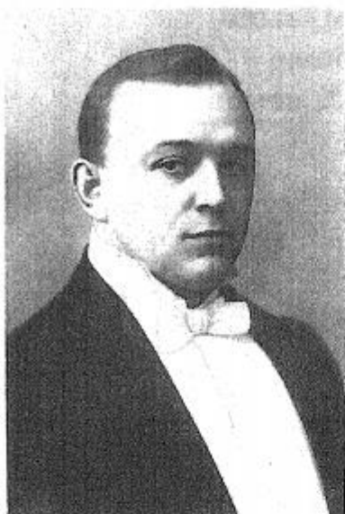
Л. В. Собинов