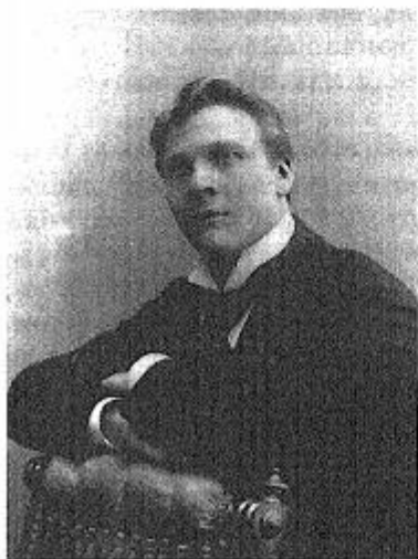
Ф. И. Шаляпин