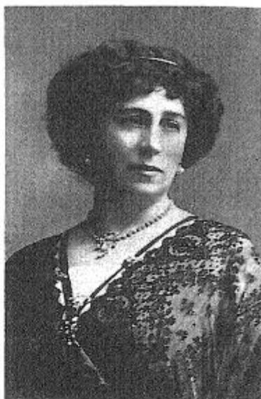
А. В. Нежданова